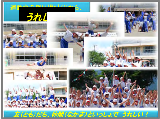
運動会の掛け声からは、

いろんなものや人に「ありがとう！」の感謝の気持ちももてて、友達といっしょに頑張れて「うれしい！」、たくさん練習してむずかしい技もできるようになって「うれしい！」…、そうして「ありがとう！」「うれしい！」がたくさん感じられたり言えたりすると、それぞれの行事や学校生活が「たのしい！」と感じられてきます。