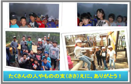
たくさんの人やもの支(ささ)えに、ありがとう！

6年生には6/1に行われた運動会の中で、「うれしい！」を感じられたことや場面を聞きます。(6年生二人にインタビュー)