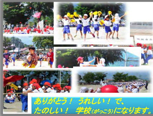
ありがとう！うれしい！で、たのしい！学校(がっこう)になります。

きっと、他の学年や学級、また皆さん一人一人もこの3つの言葉に関わって頑張ったことがたくさんありますね。皆さんの頑張りで、大きな